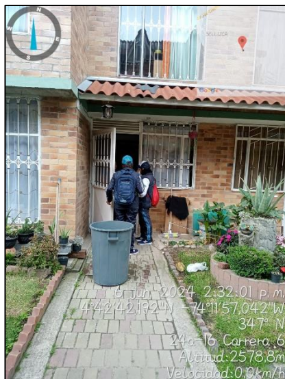
Ilustración 7. Urbanización Terraza de Yerbabuena

Dado a que no fue posible identificar las personas que realizaron la disposición inadecuada, se realiza sensibilización con la comunidad de la urbanización Terraza de Yerbabuena sobre la adecuada disposición de los residuos sólidos, especiales(colchones) y de construcción y demolición con la empresa prestadora del servicio domiciliario o gestor autorizado.