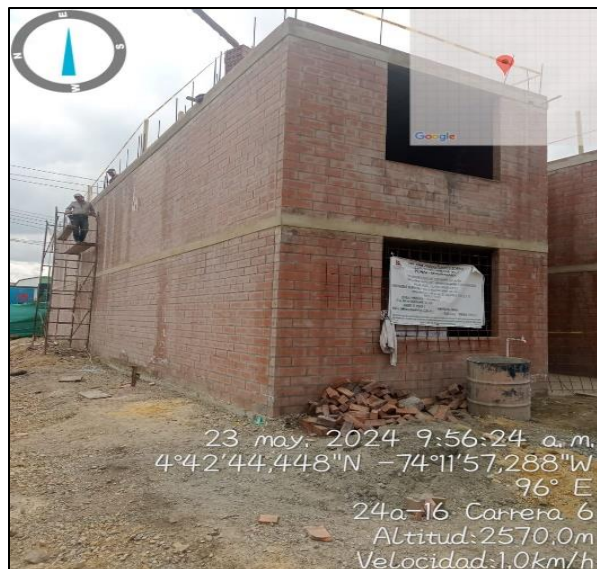
Ilustración 4. Visita de control Nuevo México