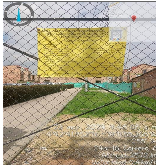
Ilustración 5. Visita de control Terraza de Yerbabuena

Teniendo en cuenta que el día 23 de mayo no fue posible realizar acercamiento con la junta de administración de la urbanización Terraza de Yerbabuena, el día 30 de mayo se realiza nuevo acercamiento, suscribiendo acta de visita ambiental No.076, la cual es atendida por el vicepresidente de la urbanización, quién manifiesta que los residuos de construcción y demolición son dispuestos en un centro de acopio temporal que se encuentra en la urbanización, se deja como compromiso que toda vez que realicen disposición de residuos especiales como (colchones, muebles) y de residuos construcción y demolición; la comunidad debe comunicarse con la EMAAF SAS ESP o gestor autorizado para la disposición de éstos, y así mismo, sacar los residuos sólidos ordinarios en los horarios establecidos por el prestador del servicio de aseo.