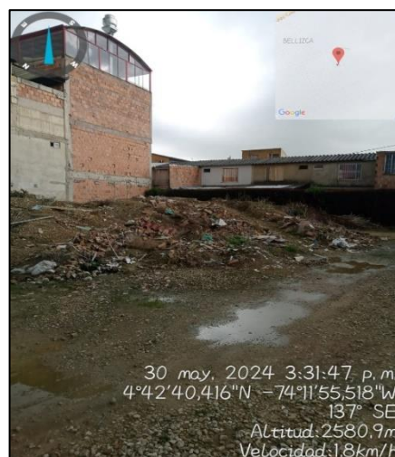
Ilustración 6. Centro de Acopio Temporal

Teniendo en cuenta que el día 23 de mayo no fue posible realizar acercamiento con la junta de administración de la urbanización Terraza de Yerbabuena, el día 30 de mayo se realiza nuevo acercamiento, suscribiendo acta de visita ambiental No.076, la cual es atendida por el vicepresidente de la urbanización, quién manifiesta que los residuos de construcción y demolición son dispuestos en un centro de acopio temporal que se encuentra en la urbanización, se deja como compromiso que toda vez que realicen disposición de residuos especiales como (colchones, muebles) y de residuos construcción y demolición; la comunidad debe comunicarse con la EMAAF SAS ESP o gestor autorizado para la disposición de éstos, y así mismo, sacar los residuos sólidos ordinarios en los horarios establecidos por el prestador del servicio de aseo.