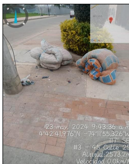
Ilustración 3. Residuos especiales