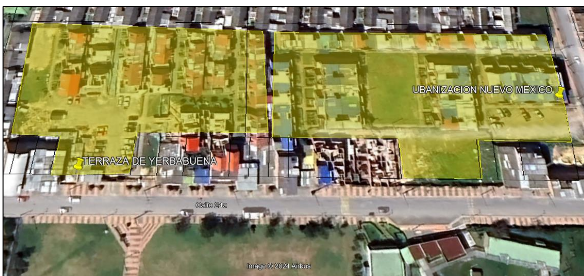
Ilustración 1. Ubicación de predios

Teniendo en cuenta que ante el municipio de Funza se interpuso queja por disposición inadecuada de residuos sólidos, personal adscrito a la Secretaría de Ambiente y Bienestar Animal realizó visitas de control y vigilancia (ver ilustración 1. Polígono amarillo) en las urbanizaciones de propiedad horizontal Terraza de Yerbabuena y Nuevo México, los días 23 y 30 de mayo del presente año, con el fin de dar a conocer los comportamientos contrarios a la limpieza y recolección de residuos, así como las medidas correctivas a aplicar en caso de incurrir en alguno de dichos comportamientos; como se muestra en la siguiente ilustración: